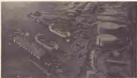
E haaf di Aruba lo bira un containerhaven moderno.

E masterplan pa modernisacion di e haaf ta inclui tambe cobamento di waaf chiquito, un mercado nobo y edificio nobo pa ferry y haaf nobo pa barconan chiquito.